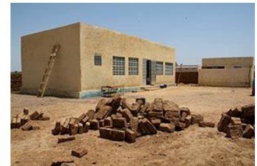
Dispensaires et Maternités