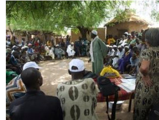
Réunions de travail