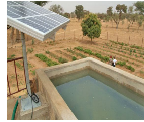
Panneaux et pompe solaire