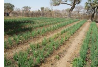
Zones de Maraîchage avec systèmes goutte à goutte