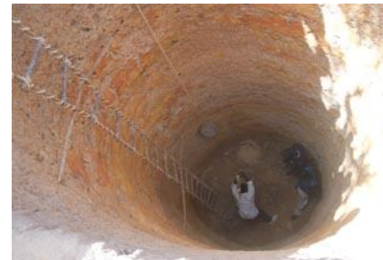
Creusements de puits + Forages