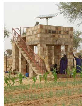
Puits et châteaux d'eau + Adduction aux villages