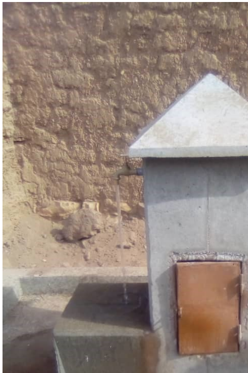
Nombo, Ensemble Cébazat, Mise en place des bornes fontaines scellement du socle du château d'eau et mise en place des panneaux solaires

L'adduction de Nombo, Ensemble Cébazat, est maintenant terminée.