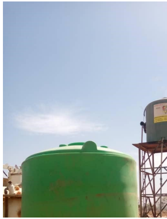
Dassi Changement de la cuve