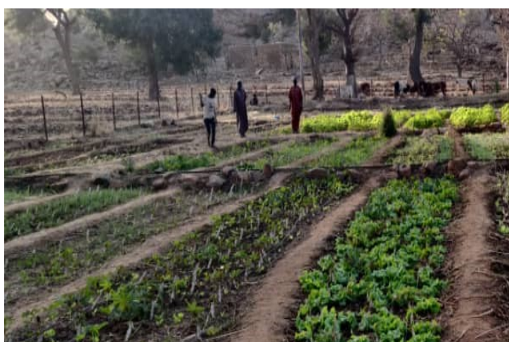
Dièye, Ensemble Chamalières