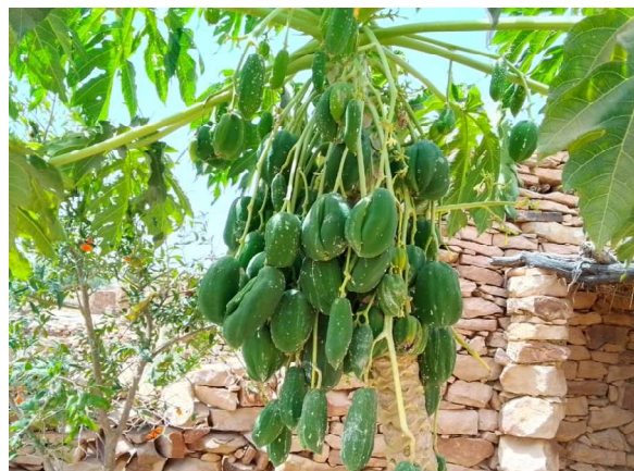
Jardin scolaire Nantaga, Ensemble Manosque