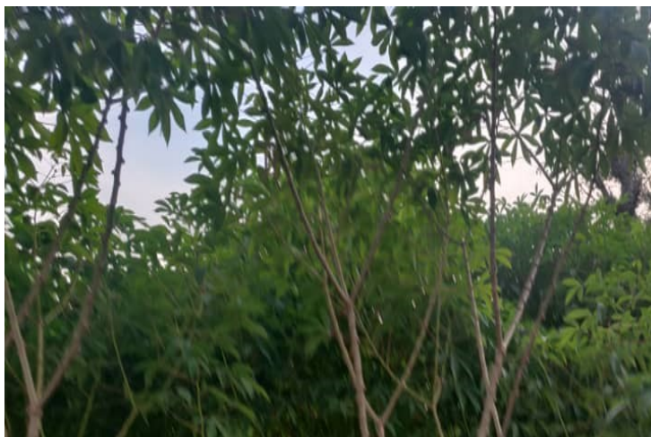
Manioc Imbisson, Ensemble Pays Mellois