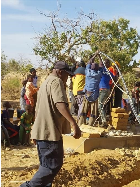
Creusement des tranchées par les hommes pour passer les câbles, scellement et pose du socle à Kansongo, Ensemble Pays Mellois

En ce début d'année 2024, l'entreprise a pu continuer les travaux commencés en 2023. Après les adductions de Komodia, Ensemble Saint-Flour, Ensemble Clermont, de Komogan, Ensemble Pays Mellois, ce sont celles de Kansongo, Ensemble Pays Mellois et de Nombo, Ensemble Cébazat qui ont été réalisées en ce début d'année.